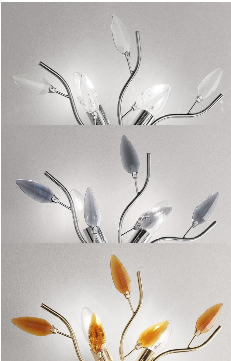
2089C Cromo / Neutro