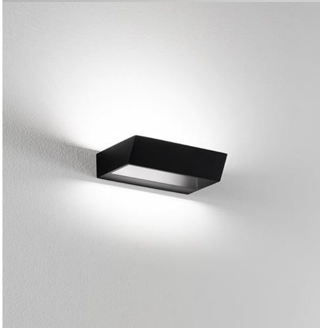
955B - 955BN Nero