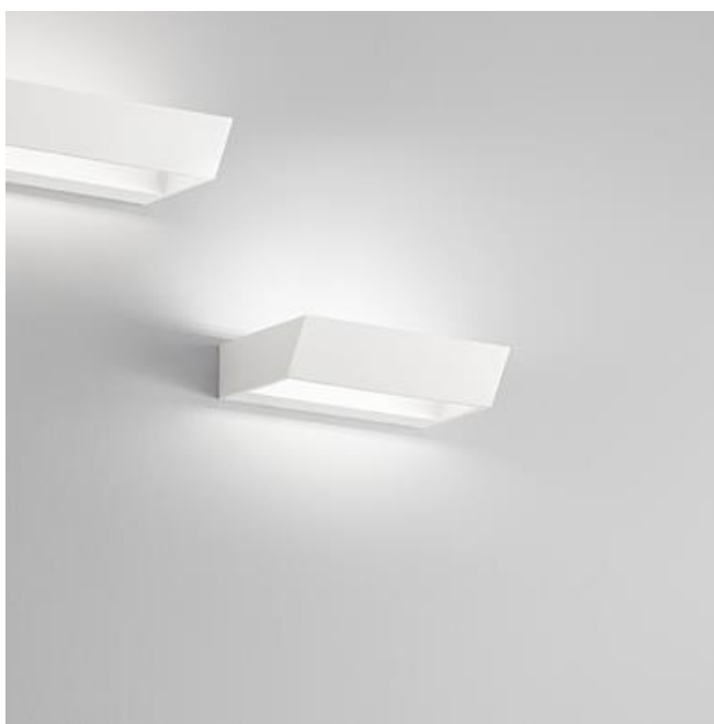
955 - 955N Bianco